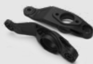
Staffa attuatore ottimizzata