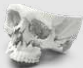
Cranio per la pianificazione chirurgica