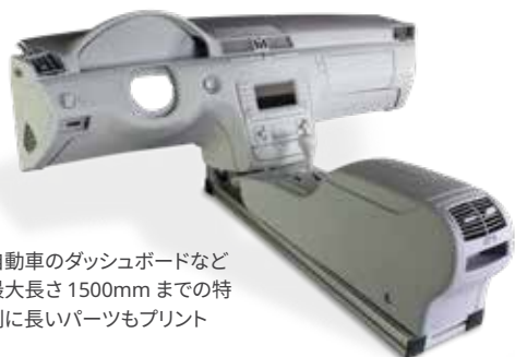
自動車のダッシュボードなど最大長さ 1500mm までの特別に長いパーツもプリント

ProJet 7000 は、ProJet 6000 の SLA のメリットをほぼ 2 倍の造型容積で提供するので、プロトタイプ用大型パーツ、高速ツーリングおよび最終用途パーツまでも微細なフィーチャディテールでプリント可能です。