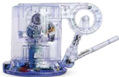
Touch 触觉式力反馈设备的功能测试和装配检查, 具有一流的透明度

采用超高速打印技术实现大规模生产运行和超凡效率。可快速互换的打印材料输送装置保持机器正常运行, 以将您的部件推进到制造工作流程, 而 3D Connect 服务则提供主动式和预防性的支持。