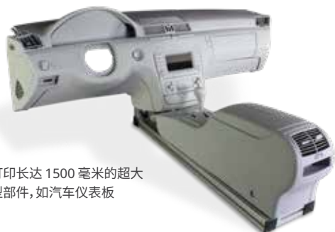
打印长达 1500 毫米的超大型部件, 如汽车仪表盘

ProX 800 和 ProX 950 SLA 打印机可构建具有卓越表面平滑度、分辨率、边缘清晰度和容差的部件。这两款打印机提供适合所有 3D 打印机的种类齐全的材料且工作效率高, 能够最大限度减少材料浪费, 维持较低的总拥有成本。再加上 3D Systems SLA 打印机拥有的卓越生产效率和可靠性, 无疑将成为专业服务机构的首选产品。