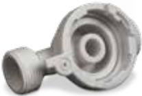
DuraForm ProX GF 소재로 프린트된 호스 피팅