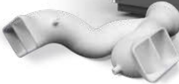
DuraForm ProX FR1200 소재로 프린트된 매니폴드