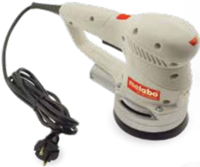
DuraForm PA 재료로 프린트한 전동 샌딩 도구 하우징

sPro SLS 시스템은 공통 아키텍처를 공유하므로 내구성이 뛰어난 고해상도 열가소성 수지 부품을 중형에서 대형 부피로 생산할 수 있습니다.