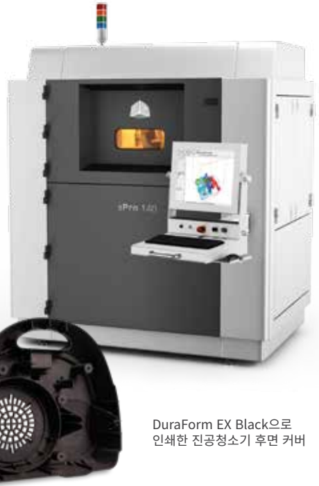
DuraForm EX Black으로 인쇄한 진공청소기 후면 커버