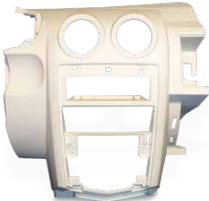
Tableau de bord en DuraForm PA