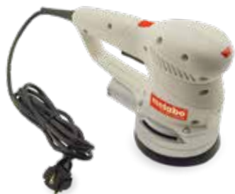
Capot de perceuse imprimé en DuraForm PA

Les systèmes SLS sPro de 3D Systems partagent une architecture commune pour produire des pièces thermoplastiques résistantes en haute résolution, disponibles en volumes de fabrication de taille moyenne à grande.