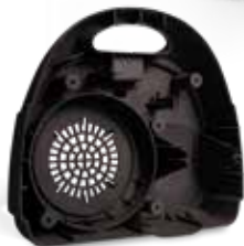
Coque arrière d'aspirateur imprimée en DuraForm EX Black